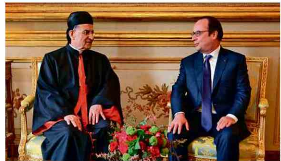
Palais de l'Élysée, le lundi 9 mai. À l'occasion de sa visite pastorale, le patriarche a été reçu par François Hollande pour échanger sur la situation précaire du Liban.

Celles-ci illustrent particulièrement au Liban, qui joue un rôle pionnier. Ce petit pays, carrefour de civilisations, est le seul du Moyen-Orient à séparer la reli-